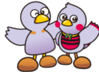
埼玉県のマスコット「コリン」「さびまっち」